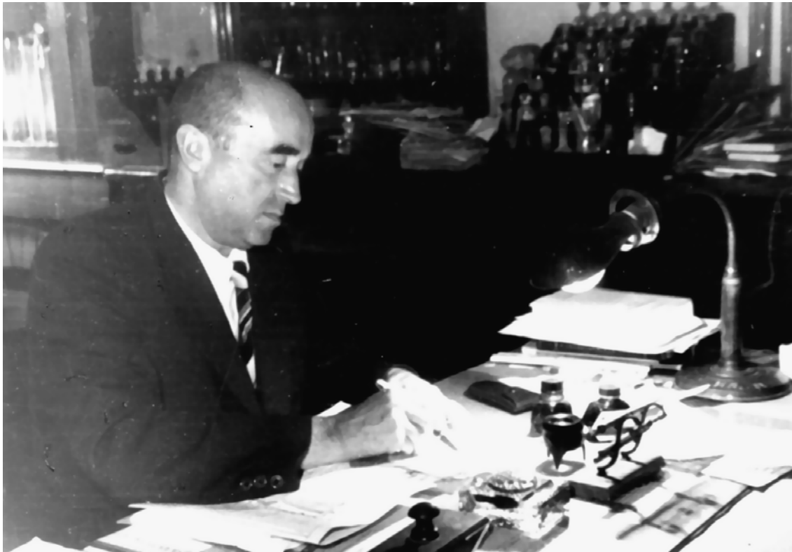
В кабінеті за робочим столом