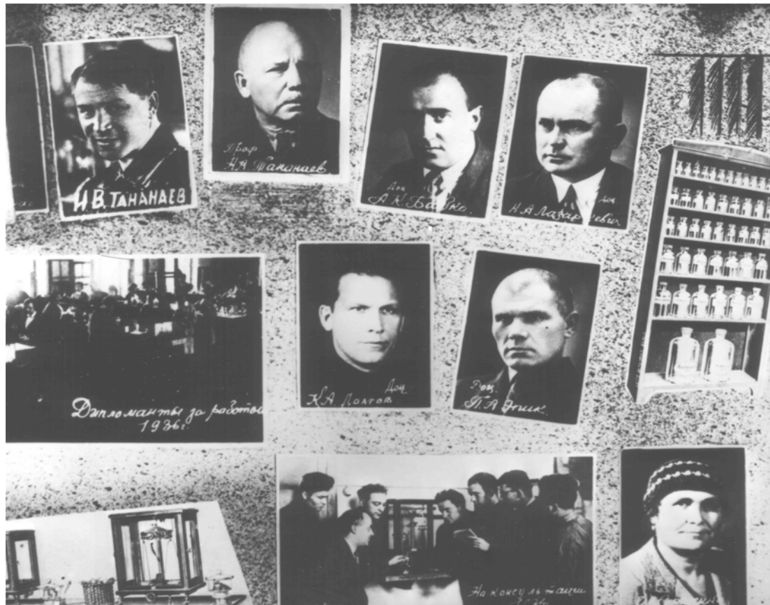
Викладачі кафедри аналітичної хімії хіміко-технологічного інституту при Київському політехнічному інституті, 1936 р.