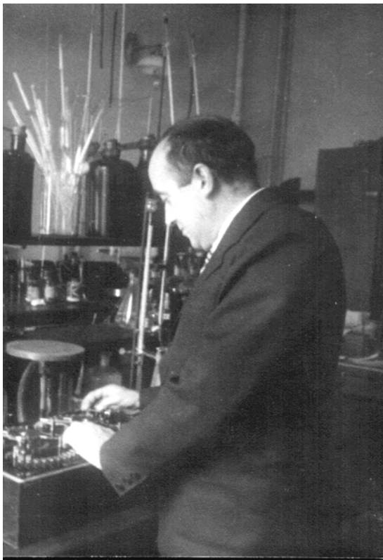
В лабораторії хімічного факультету Київського університету ім. Тараса Шевченка, довоєнні роки.